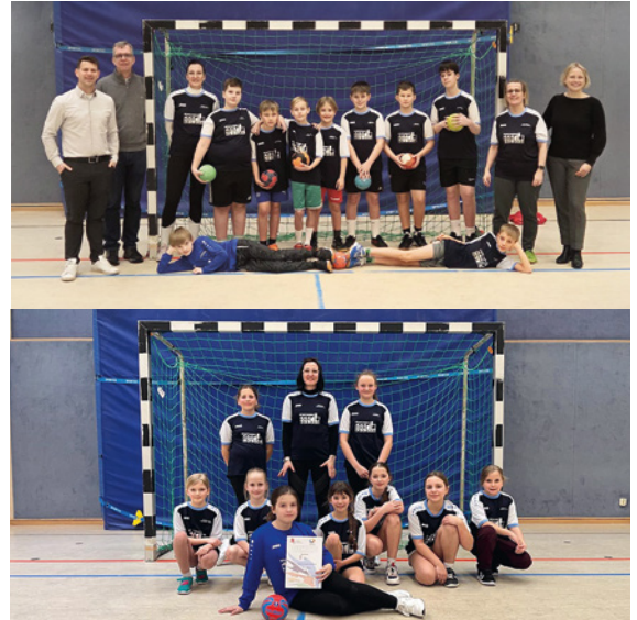
Die Teams der Geschwister-Scholl-Grundschule